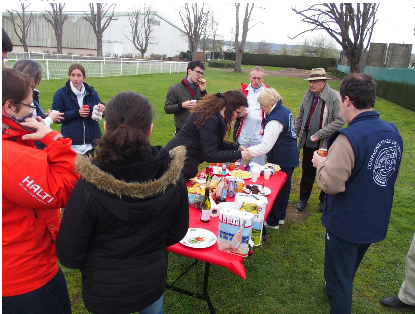
Un apéro bien mérité