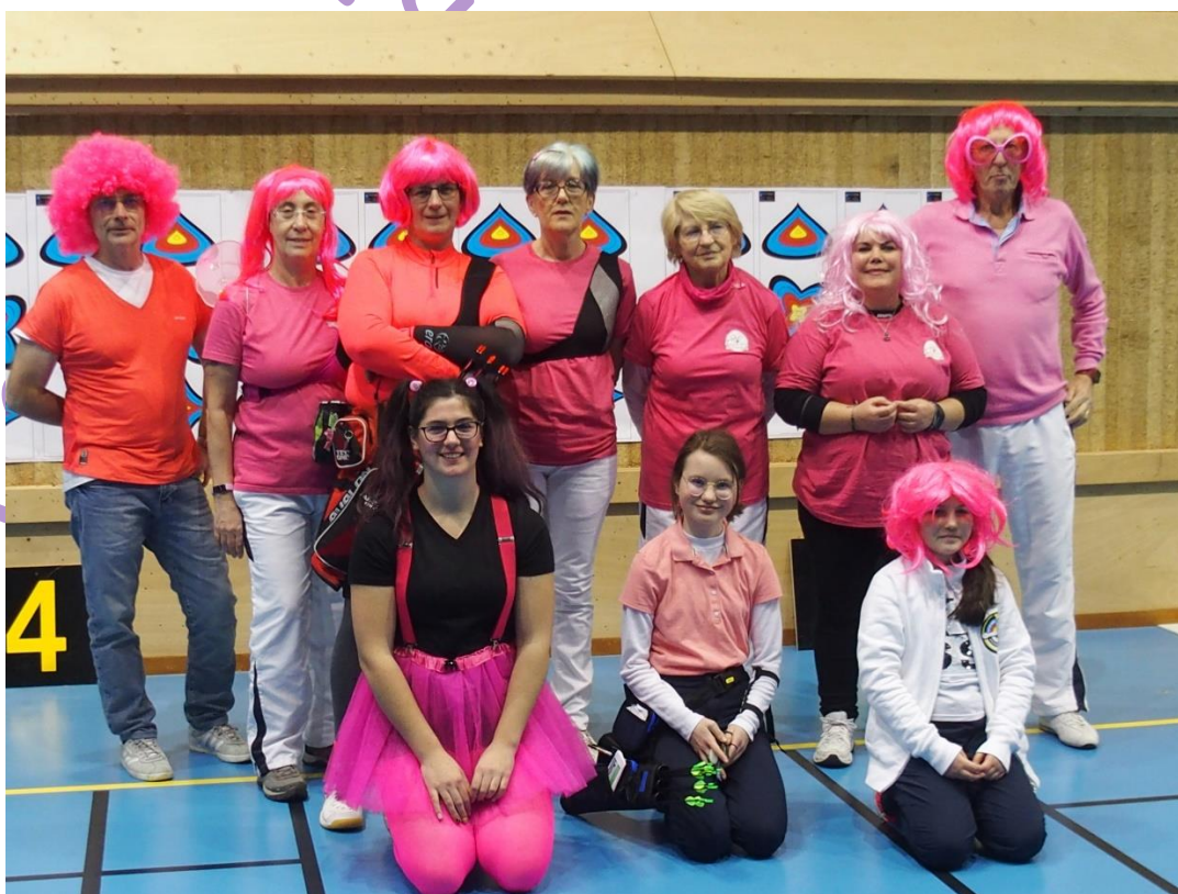
L'équipe des Miss Vernonnaise (cherchez l'erreur)