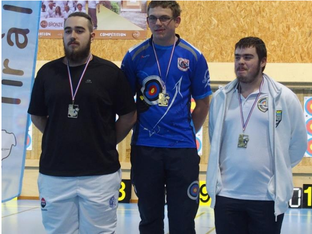
Gabriel Zede en Bronze