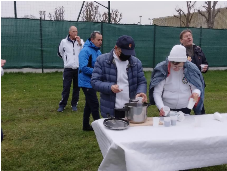
Le vin chaud et la galette