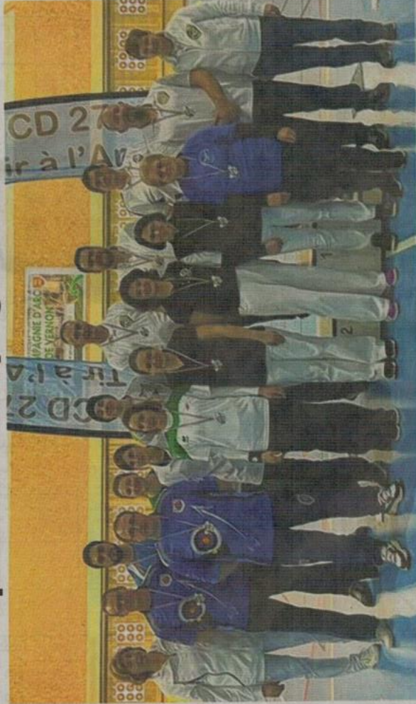
La Compagnie d'arc de Vernon a décroché huit médailles, dont quatre titres, lors des championnats départementaux de tir à l'arc.

« Dans cette épreuve il faut, pour espérer approcher le podium, un mental très fort et rodé par de nombreuses séances d'entraînement spécifiques »,