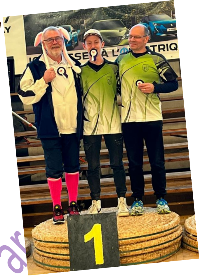
Miss Stéphane avec de belles chaussettes