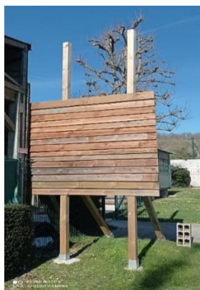
La garde erre