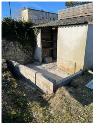
Et un et deux et trois agglos