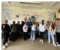
Les élèves de 6 e ont bénéficié d'une heure par classe d'apprentissage de l'allemand.

Le départ de la parade se fera depuis l'abbaye Saint-Jean-des-Vignes et se terminera à la cathédrale pour une messe par l'évêque de Soissons. « Nous avons fait le choix de Saint-Jean-des-Vignes pour son cadre prestigieux et magnifique », avoue la secrétaire. ■