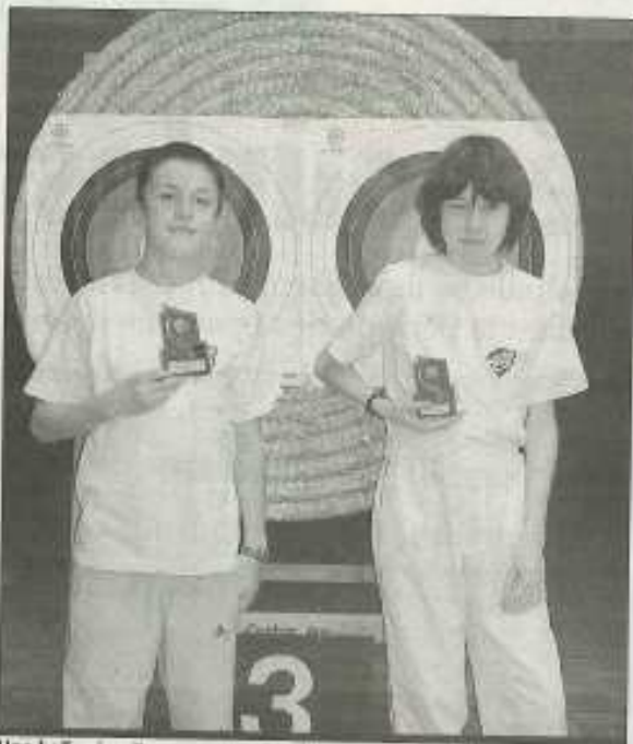
Une belle réussite pour une première