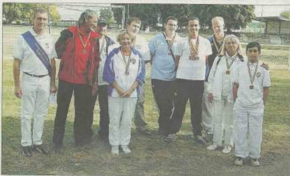
Le groupe des médaillés

Cette année, c'est le département de l'Eure qui était chargé d'organiser le championnat régional de tir au Beauvais. La Cie d'Arc de Vernon, dotée à l'heure actuelle du seul jeu d'arc dans le département capable d'accueillir une telle manifestation, a organisé cette finale les 12 et 13 septembre derniers au jardin d'Arc André Pauquet de Vernouillet.