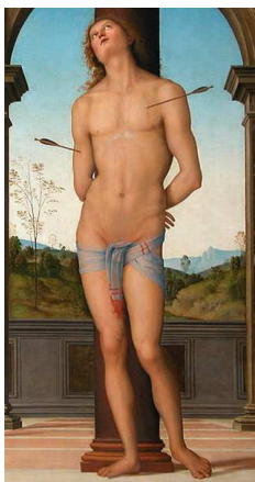
Le martyr de St Sébastien de Pietro di Cristoforo Vannucci. Musée du Louvre

Dioclétien le condamna à mort. Attaché à un arbre, il fut percé de flèches et laissé pour mort. Venue chercher son corps pour l'ensevelir, la pieuse Irène s'aperçut qu'il vivait encore et le soigna. Il avait survécu aux flèches des hommes.