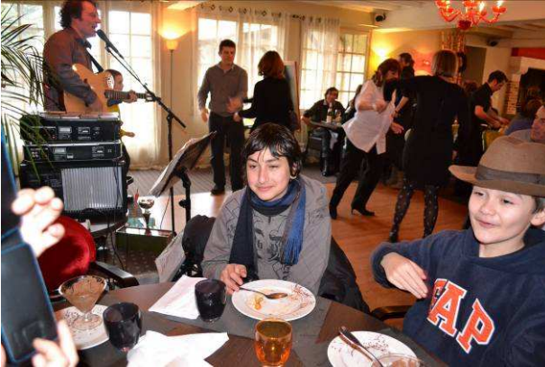
Petits et grands à la fête

La souris d'agneau est savoureuse et moelleuse à point, les serveurs sont aimables. L'ambiance est colorée et festive.