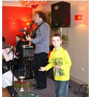
Un nouveau guitariste ?